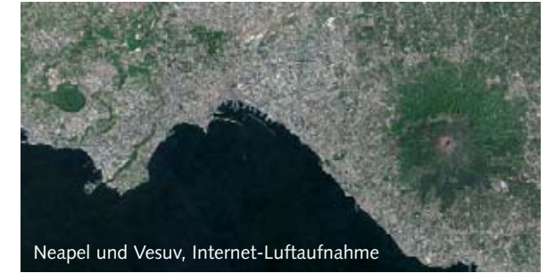
Neapel und Vesuv, Internet-Luftaufnahme

Ausrüstung: „Die Familie nahm die Kernvorräte aus der Speisekammer, sie packte eine gehörige Portion heimische Lebensart in den VW-Käfer – und so war dann mit allerlei Hartwürsten und mit Schweinskopfsülze im Einmachglas das Überleben in der Fremde gesichert“, erinnert sich Heribert Prantl. Dazu passt, dass laut Statistik die Deutschen der Wirtschaftswunderzeit den Kontakt zu den Einheimischen eher mieden und amouröse Abenteuer, die in den Schlagern häufig besungen wurden, die Ausnahme blieben.