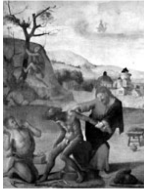
Piero di Cosimo: Prometheus be- lebt den Menschen, 1510, Aus- schnitt. Alte Pinakothek München

Während sich alttestamentlicher Psalm und der Hymnus des Ordensreformators im Lob des Schöpfergottes einig sind, ist das Goethegedicht aus seiner Sturm-und-Drang-Phase ein geradezu provozierender Text, der mit Hilfe griechischer Mythologie vieles Heutige vorwegnimmt. Der Dichterstürm findet jedoch bald versöhnlichere Töne, die im Kantschen Sinn die „Bedingungen der Möglichkeit“ für den ethisch handelnden Menschen reflektieren. – Rilkes anrührende Erzählung darf in der Tradition der Worte Jesu über die Kinder verstanden werden; seine Gedichtverse enden in Fragen, die weit über diesen Abend hinaus Bestand haben werden.