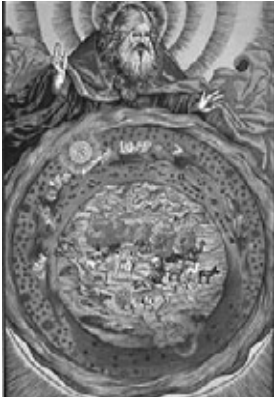
Gott erschafft die Welt

Dass eine solche Frage nach dem Stellenwert und den Entfaltungsmöglichkeiten der Gattung Mensch überhaupt ernsthaft gestellt werden kann, spiegelt eine wohl keineswegs linear verlaufende Entwicklung wider, die eine fast „kindliche“ Verehrung der Gottheit, ein an Hybris grenzendes Aufbegehren und einen ethisch vertretbaren Standpunkt enthält, der die Verantwortlichkeit des Menschen für die ganze Schöpfung erkennen muss, einschließlich den Teil, den die Menschheit selbst darin einnimmt.