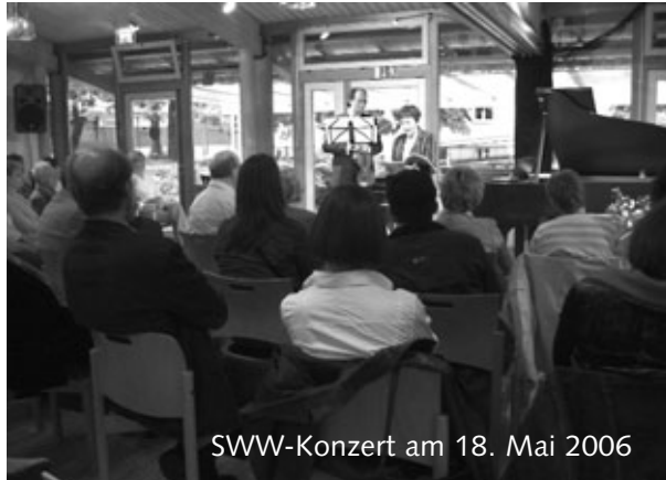
SWW-Konzert am 18. Mai 2006